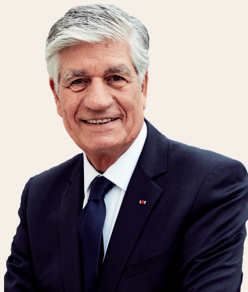
Maurice Lévy Président du Conseil de surveillance

“ Cela fait maintenant quelques années que nous avons initié une indispensable transformation de notre organisation, de notre façon de travailler pour nous adapter aux bouleversements de notre industrie sous l'effet du numérique et de l'innovation afin de mieux accompagner nos clients. ”